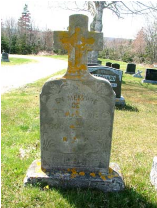
12) Pierre tombale de Francoie [François] C. Le Blanc dans le cimetière Saint-Michel à Wedgeport. Le monument est en ciment et, comme beaucoup d'autres monuments de ce genre, il est de fabrication locale.