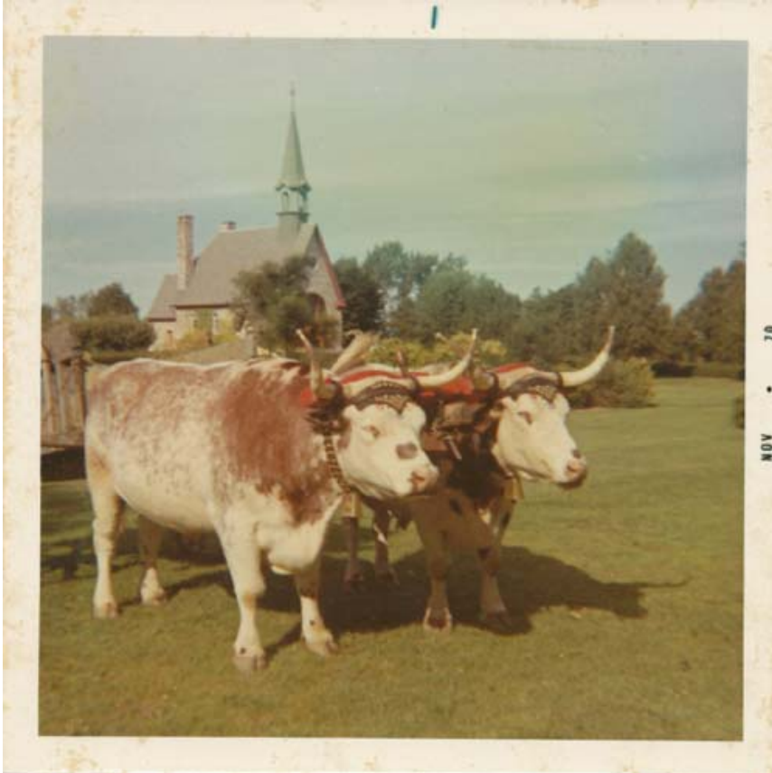
10) Bœufs à Grand-Pré (1976)