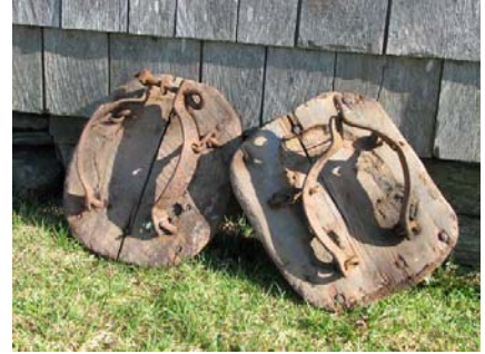
11) «Raquettes à marais» pour bœufs.