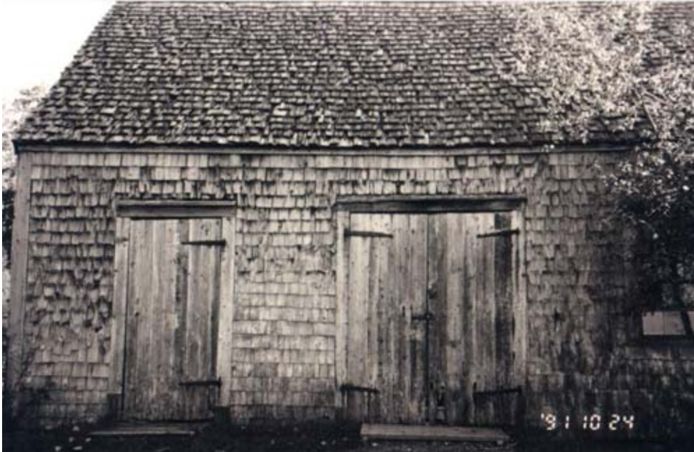
8) La forge reconstruite à Grand-Pré en 1967 (photo prise en 1991)